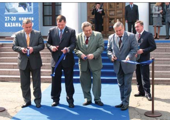
Торжественное открытие выставки