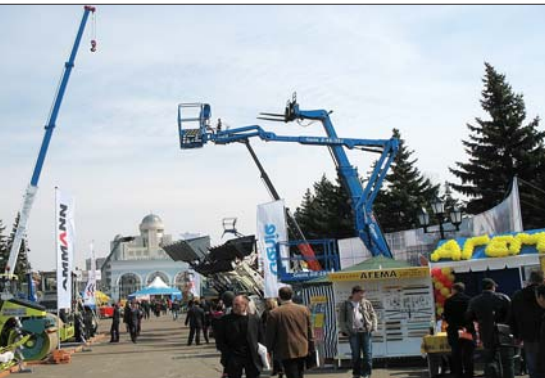
На открытых площадках «ВолгаСтройЭкспо»