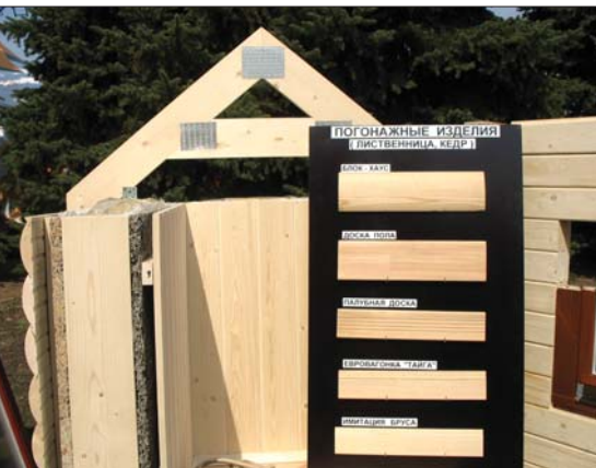
Современная каркасная технология строительства малоэтажных домов продемонстрирована ЗАО «Домостроительный комбинат клееных модульных конструкций» (Елабужский район РТ)